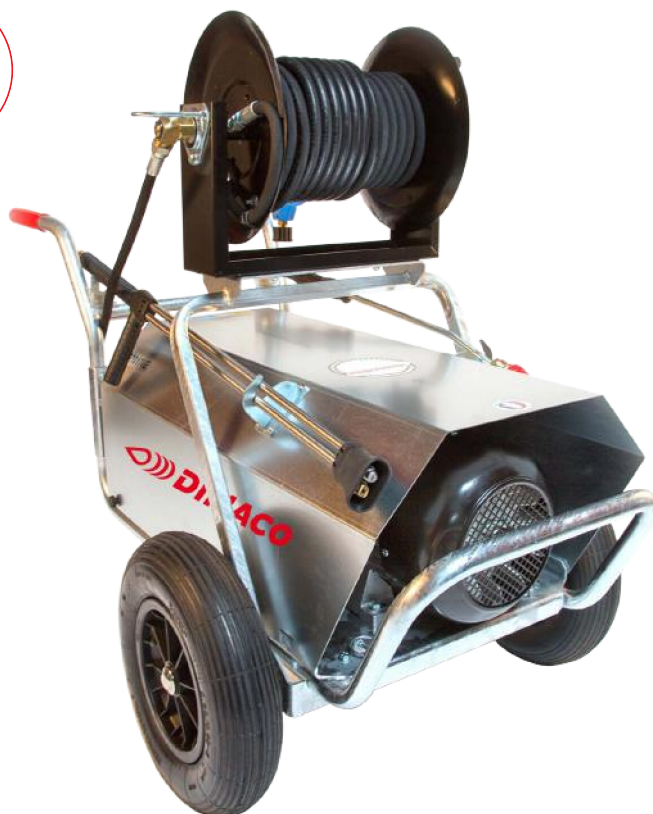
IG 26 150 E - IG 30 170 E IG 26 150 E ST - IG 30 170 E ST