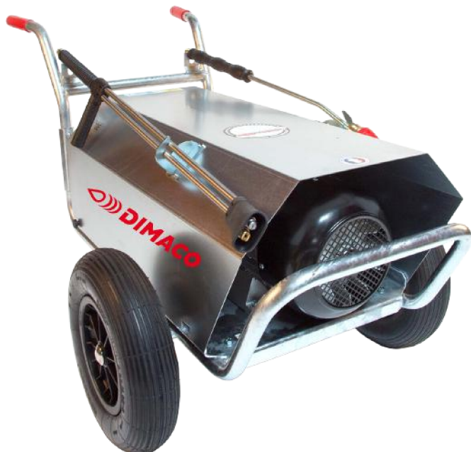
IG 26 150 - IG 30 170 IG 26 150 ST - IG 30 170 ST